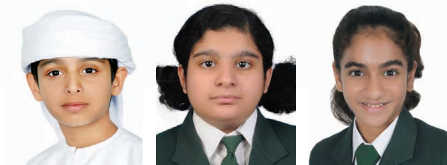
محمد عبدالله آل علي

HH Sheikh Hamdan bin Rashid is a person who is a guiding light for our society. He is not only motivating students but also the society to give its best by saving the environment and helping out people.